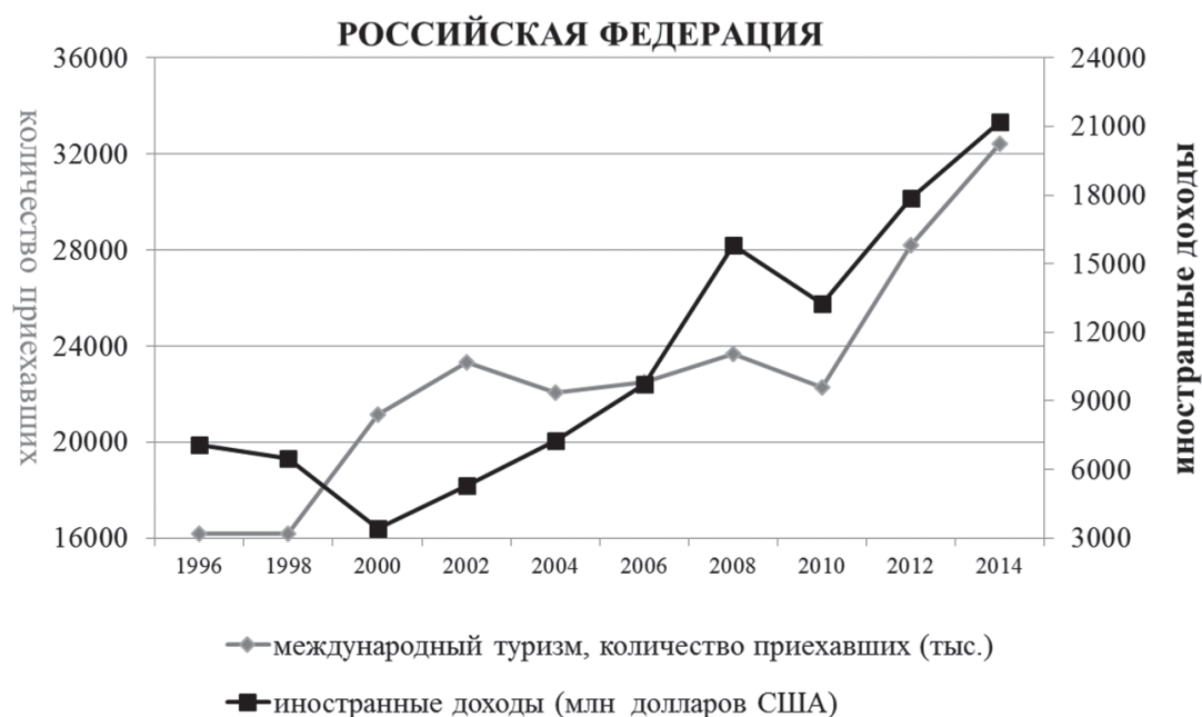
Рис. 2. Сравнение иностранных доходов и количества приезжающих в международном туризме Российской Федерации

Качество человеческих ресурсов в экономике гарантирует, что вторичный и третичный секторы экономики имеют достаточное количество рабочей силы для своего роста и развития. Указанный индикатор дополнительно специфицирует объединенные с практикой образование и профессиональную подготовку, а также меры по обеспечению качества системы образования. Лучших результатов в рамках человеческих ресурсов Россия добилась в 2015 г., когда заняла 38-е место из 141 оцениваемого государства (табл. 2).