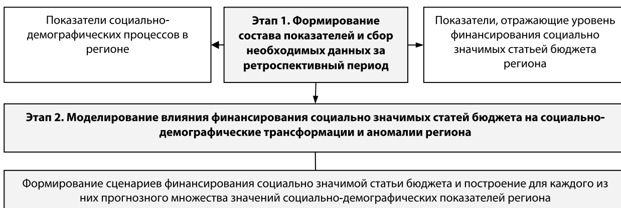
Рис. 1. Алгоритм моделирования социально-демографических процессов в регионе

Система показателей смертности сформирована из показателей, характеризующих уровень и структуру смертности, которые находятся под воздействием внутрироссийских изменений и определяются характеристиками эпидемиологического перехода. Кроме того, данная система включает показатель числа умерших мужчин трудоспособного возраста, отражающий социально-демографические аномалии.